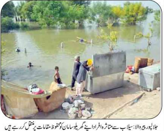
جلاوطنی والا، سیلاب سے متاثرہ افراد اپنے گھر کیلئے سامان محفوظ نگہداشت پر منتظر کمرہ ہے

پنجاب میں مرالہ سے پچھلے دنوں کوئی بیک نہیں ہے اور جسو سے سدھنا تک پانی نازل سطح پر آچکا ہے تلنگ پربت زیادہ ہے، بہت سی کنویںوں پر پونڈ لگ ختم ہو رہی ہیں، ایم 5 مہرے 22 گلو میٹر کا پانی کی وجہ سے بند ہے اسلام آباد (انٹرنیٹ ڈیسک) پربت ختم ہوا، آبیوں میں صورتحال معمول کے آہستگی کے ساتھ ہے، پنجاب میں مرالہ سے پچھلے دنوں کوئی بیک نہیں ہے اور جسو سے سدھنا تک پانی نازل سطح پر آچکا ہے۔