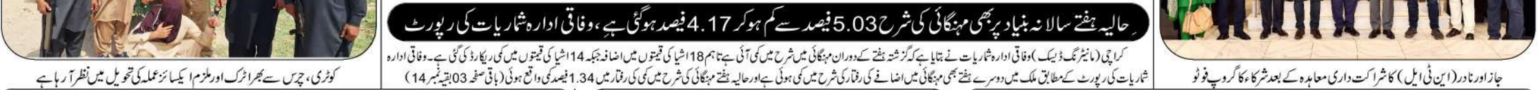
جلاوطنی والا، سیلاب سے متاثرہ افراد اپنے گھر کیلئے سامان محفوظ نگہداشت پر منتظر کمرہ ہے

مال بردار ٹریڈنگ کی بجکاری کا معاملہ کٹھالی میں پڑ گیا، اوپن نیٹ کی اعلان مال بردار ٹریڈنگ کی بجکاری کا معاملہ کٹھالی میں پڑ گیا، اوپن نیٹ کی اعلان