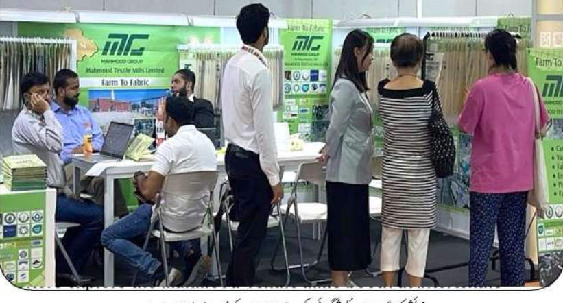
مناشی کنندگان انٹرنیشنل ٹیکسٹائل ایکسپو میں صنموات کی خریداری میں مصروف ہیں

اگست 2025ء کے اختتام تک بینکوں کی جانب سے نجی شعبے کو قرضہ جاتی فراہمی میں اضافہ گزشتہ مالی سال کے اختتام تک بینکوں کی جانب سے نجی شعبے کو قرضہ جاتی فراہمی میں اضافہ کراچی (ماٹریٹنگ ڈیسک) بینکوں کی جانب سے نجی شعبے کو قرضہ جاتی فراہمی میں اضافہ