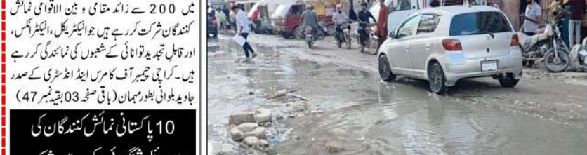
کراچی (کامرس رپورٹر) گل پلاز مارکیٹ مارشروں کو ختم کرنے کا مطالبہ

گل پلاز مارکیٹ مارشروں کو ختم کرنے کا مطالبہ تاجروں کو خریداریوں کو سخت مشکلات کا سامنا ایک ہفتہ گزار کر کیا مستقل نہیں ہوا کراچی (کامرس رپورٹر) گل پلاز مارکیٹ مارشروں کو ختم کرنے کا مطالبہ